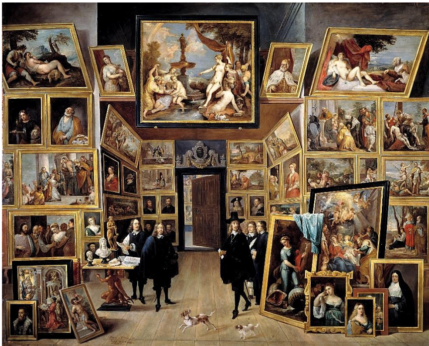
Davido Tenirso jaunesniojo (David Teniers) paveikslas „Erchercogas Leopoldas Vilhelmas savo paveikslų galerijoje Briuselyje“, 1651 m.