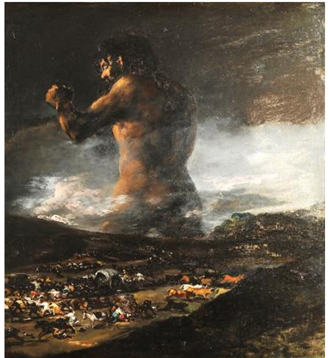
Fransisko Gojos (Francisco Goya) paveikslas „Kolosas*“, 1812 m.

* Kolosas (gr. kolossos) – milžinas, gigantas.