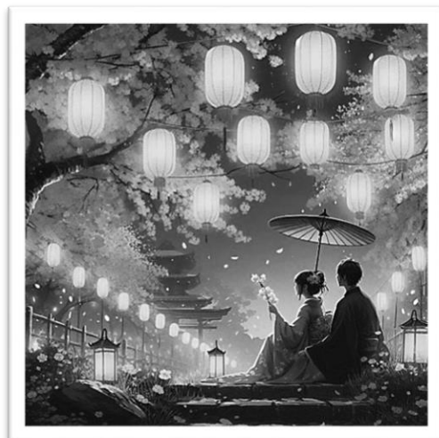
MS Bing IC