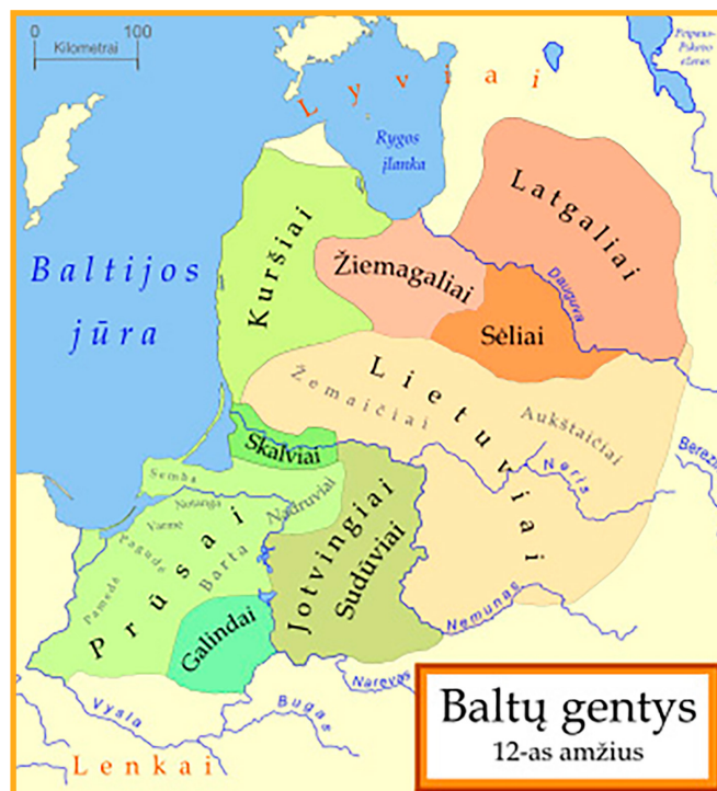
Baltų gentys 12-as amžius

Baltų gentys XII a. pagal M. Gimbutienę. (Prieiga per internetą: http://www.ethn-cart.lt/index.php?option=com_content&task=view&id=23&Itemid=150 ).