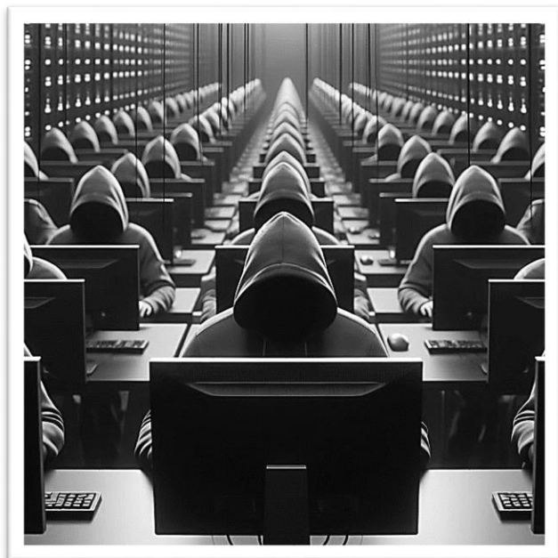
MS Bing IC

Aufgabe: Schauen Sie sich die Bilder an und sprechen Sie zum Thema nach folgenden Fragen.