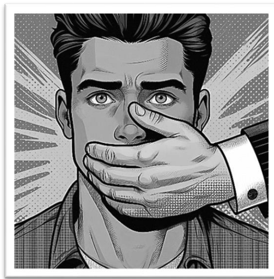
Microsoft Bing IC