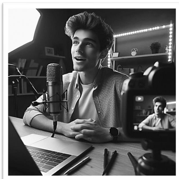
MS Bing IC