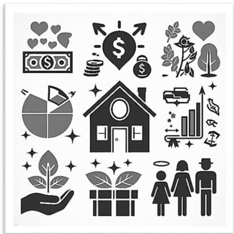
MS Bing IC

Aufgabe: Schauen Sie sich die Bilder an und sprechen Sie zum Thema nach folgenden Fragen.