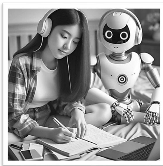
MS Bing IC